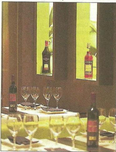
NONSOLCAFFÉ. Un ambiente con personalidad propia y un estilo inconfundible.

Considerado como uno de los principales referentes de la auténtica cocina italiana en Madrid, Nonsolocaffé ha sido nombrado a lo largo del presente año Ristorante raccomandato 2012 por L'Accademia